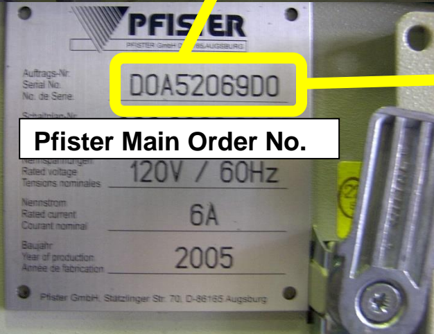
Pfister Main Order No.