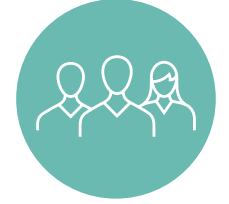
Bakım ve işletme eğitimi