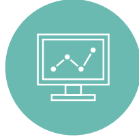
İşlevsel devreye alma