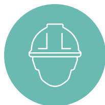
Trabajos de ingeniería

meticulosamente y con el propósito de tener todo listo y funcionando tan rápido como sea posible. Para todas sus necesidades de comisionamiento y mucho más, nuestros completos paquetes de servicio aseguran no solo que sus equipos están listos para funcionar, sino también que su gente lo esté gracias a la capacitación de mantenimiento y operación que ofrecemos como un elemento central del alcance de nuestro suministro. Después de todo, los mejores equipos merecen las mejores prácticas.