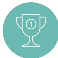
Comisionamiento de rendimiento