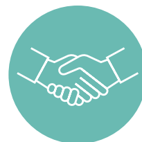
Aceptación de la planta y garantías de rendimiento