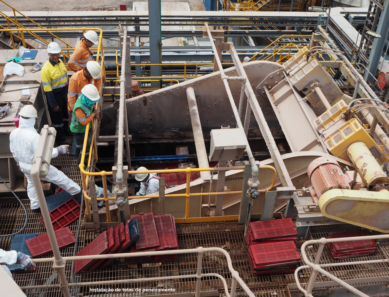
Instalação de telas de peneiramento