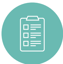
Проверки в ходе пусконаладки